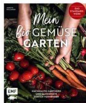
Mein Biogemüse-Garten Annette Holländer

Die Autorin ist Bloggerin und Social-Media-Redakteurin. Hier zeigt sie anhand vieler Fotos, Pläne, Pflanzempfehlungen und Tipps aus eigener Erfahrung, wie man auch mit wenig Zeit einen blühenden Garten gestalten kann und trotzdem noch Zeit behält, ihn zu genießen.