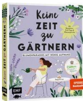
Keine Zeit zu gärtnern Sonja Di Leo

Auf dieser Seite haben wir für Sie eine Auswahl an Büchern zum Start der Gartensaison zusammengestellt.