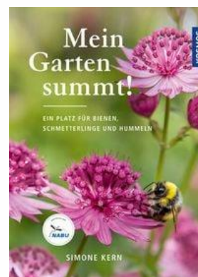
Mein Garten summt Simone Kern

Die Landschaftsarchitektin stellt die Anlage und Bepflanzung eines Naturgartens mit heimischen Wildpflanzen vor. Präsentiert werden Gestaltungsideen und Pflanzkombinationen in Abhängigkeit von Licht, Bodenbeschaffenheit und Feuchtigkeit sowie geeignete Pflanzen.